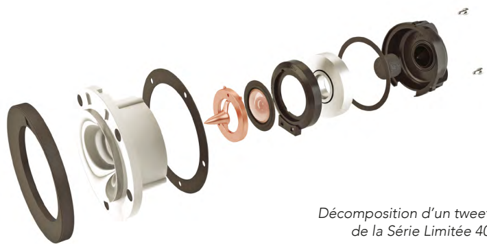
Décomposition d'un tweeter de la Série Limitée 40th